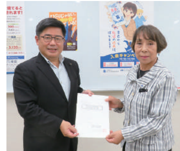
斉藤やすひろ都議 (公明党)