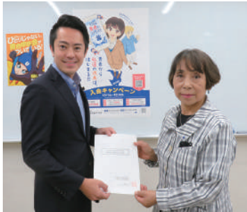
青木英太都議 (自由民主党)